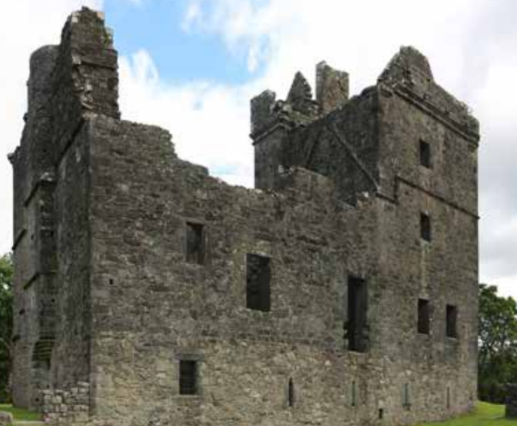
Caisteal Chàrn Asaraidh, faisg air Cille Mhàrtainn ann an Earra Ghàidheal, far an robh Séon Carsuel, Easbaig Earra Ghàidheal a' còmhnaidh. B' e an Carsalach Mòr, a chuir a' chiad leabhar Gàidhlig, 'Foirm na nUrruidheadh' ann an clò ann an 1567