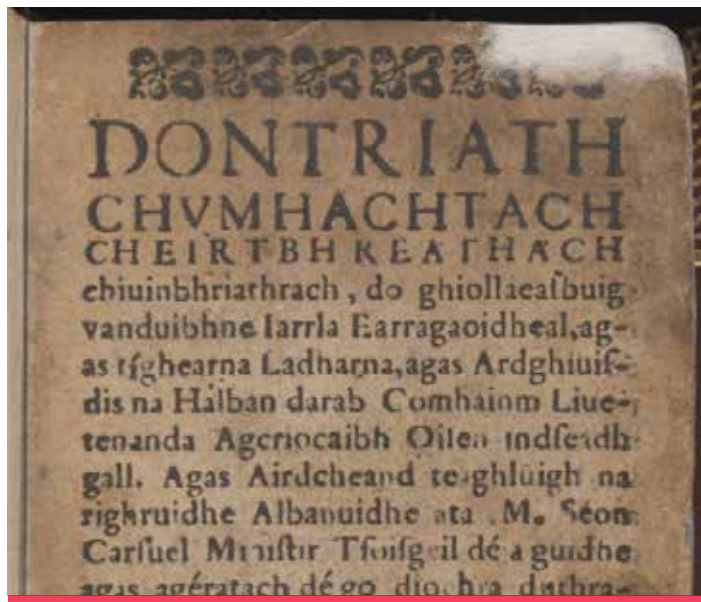
Foirm na nUrruidheadh' a chaidh fhoillseachadh ann an 1567 © Priomh Leabharlann Oilthigh Dhùn Èideann.

Am Fìor-Urr. An t-Ollamh Aonghas Moireasdan