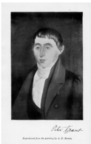
Pàdruiig Grandd nan Òran (1783 – 1867)

Thuig mise an sgeul ud gun d’ èirich grian oirn’ 's chunna mi reult anns na speuran shìos ud, 's daoine glic ag èirigh, 's lean iad an reult ud 's dh’aindeoin Herod thug iad gèill mar Dia dha.