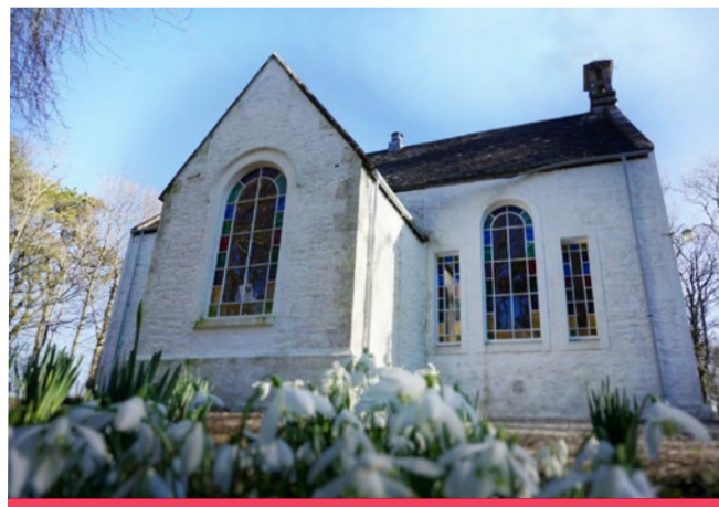
Eaglais Cill Mheinidh

'S fhada o bha adhradh Crìosdail ann an Cill Mheinidh, Ìle. Tha làrach na seann eaglaise Ceiltich sa bhaile, faisg air an eaglais seo, ach chan eil mòran fiosrachaidh ann ma deidhinn. Thogadh Eaglais Cill Mheinidh ann an 1828 leis an iomairt phàrlamaideach a stèidhich trì eaglaisean san eilean, air an dealbhachadh le Tòmas Telford. Nas fhaide dhen linn, chaidh ailtireachd na h-eaglaise atharrachadh le oighre Caimbeulaich Ìle. Tha i an-diugh ceangailte ri paraiste Cille Chomain agus Port na h-Abhainne.